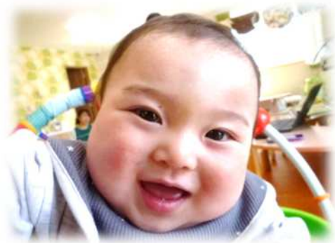
ひよこ組 OOOOくん 1歳