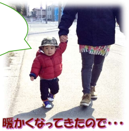
暖かくなってきたので...