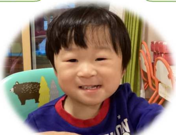
〇〇 〇〇〇くん 2歳