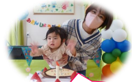
ちゃん 歳おめでとう