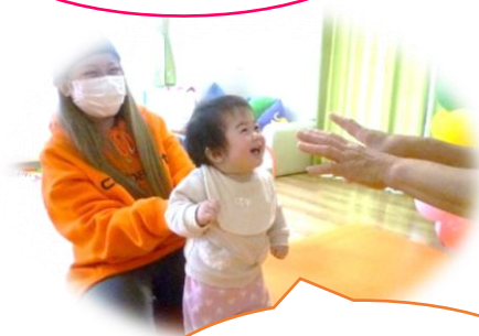
おーやつを たべよ♪