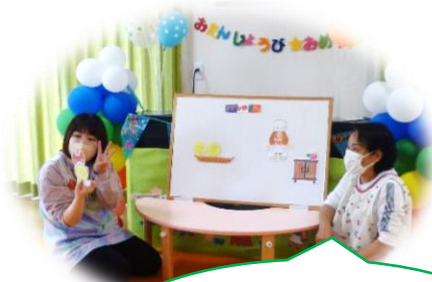
「パン屋に5つのメロンパン」