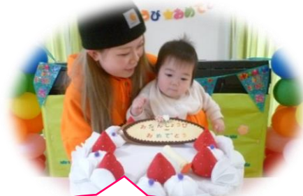
ちゃん 歳おめでとう