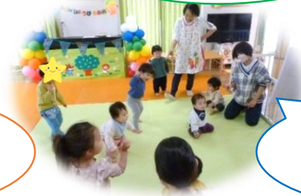
できるかな体操は みんな大好き♡